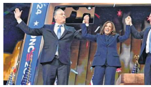
(L-R) Douglass Emhoff, Kamala Harris, Tim Walz and his wife at the end of the Democratic National Convention in Chicago, Illinois, on Thursday