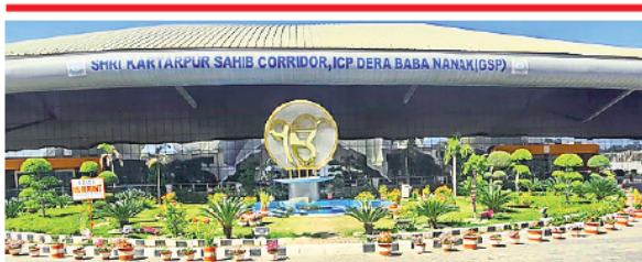
ਭਾਰਤ-ਪਾਕਿਸਤਾਨ ਸਰਹੱਦ 'ਤੇ ਸ੍ਰੀ ਕਰਤਾਰਪੁਰ ਸਾਹਿਬ ਲਾਂਘੇ।