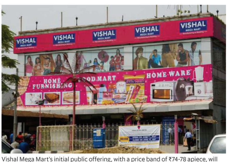
open for subscription on 11 December and close on 13 December.

employed was around 71% last year, offering confidence to accelerate newstore rollouts, Kapur added. The retailer that sells apparel, fast-moving consumer goods (FMCG) as well as