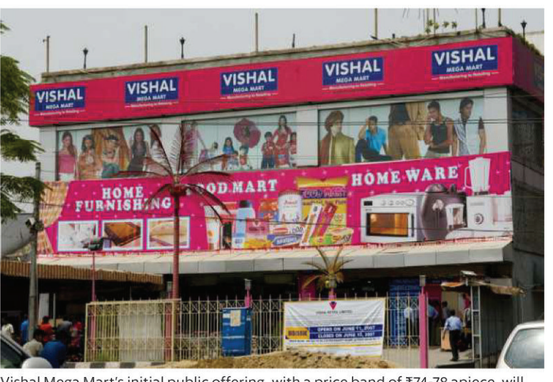
Vishal Mega Mart's initial public offering, with a price band of ₹74-78 apiece, will open for subscription on 11 December and close on 13 December.