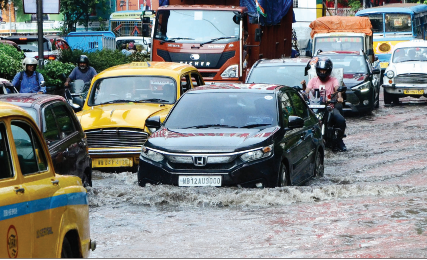
মঙ্গলবার সকাল ৬ দুপুরের ব্যু্টিতে জলময় এম জি রোড।

বলেছেন, ‘এই মুহূর্তে বাংলার অবস্থা উদ্বেগজনক। ছাত্ররা সরকারের উপর বিশ্বাস হারিয়েছেন, যুবকেরা ভীতসন্ত্রস্ত, আর মহিলারা রয়েছেন হতশাশ্ব। নাগরিকদের সুরক্ষা দেওয়া সরকারের দায়িত্ব। কিন্তু এই ঘটনার পর প্রশ্ন উঠছে সরকারের ভূমিকা নিয়ে।’ সাম্প্রতিক ঘটনাটি দেখে আতঙ্ক দিয়ে দেখিয়ে দিয়েছে সরকারের গাফিলতি। কলকাতা পুলিশের ভূমিকা নিয়েও প্রশ্ন তুলেছেন রাজ্যপাল। তাঁর মতে, কলকাতা পুলিশ ‘দুর্নীতিগ্রস্ত’ এবং ‘রাজনৈতিক মদতপুষ্ট’। সেই সঙ্গে মঙ্গলবার থেকেই রাজ্যভবনে বিশেষ একটি কমিটি রুম খুলেছেন রাজ্যপাল। আরজি কর-কাণ্ড নিয়ে সাধারণ মূল্যে ০৩৩২২০০১৬৪১ এবং ৯২৮৯০১০৬৮২— এই দুটি নম্বরে ফোন করে মতামত জানাতে পারবেন। কলকাতা পুলিশের সাক্ষাৎকারে রাজ্যপাল বলেন, ‘এই ঘটনা নিয়ে সার্বভৌম রাজ্যপাল। বর্তমানে দিল্লিতে রয়েছেন তিনি। মঙ্গলবার রাষ্ট্রপতি দ্রৌপদী মূর্মু ও উপরাষ্ট্রপতি জগদীপ ধনখড়ের সঙ্গে দেখাও করেন। রাজ্যপালের দিল্লি সফর থিরে রাজ্য রাজনীতিতে চলছে নানা গুঞ্জন।