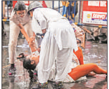
प्रदर्शनकारी आपाधि कार्यकर्ताओं को हिरासत में लेती महिला पुलिसकर्मी।

प्रदर्शनकारियों ने मुख्यालय में मत्ता बरनी के इस्तेमाल की मांग की, जो राज्य की स्वास्थ्य मंत्री और गृह मंत्री भी हैं। एक वरिष्ठ अधिकारी ने कहा कि पुलिस ने स्वास्थ्य विभाग के मुख्यालय 'स्वास्थ्य भवन' को और जाने वाली सड़कों पर अवरुधक लगा दिए हैं, जिन्हें आपाधि कार्यकर्ताओं ने हटाने की कोशिश की। आपाधि की एक महिला ने कहा, 'हम निर्दम मुख्यालय को इस्तेमाल करते हैं। (आर जी)