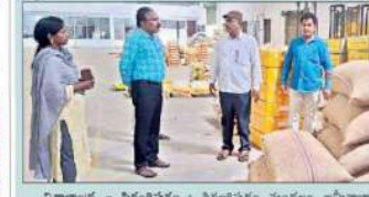
తులసి సీడ్స్ కంపెనీలో వ్యవసాయాధికారుల తనిఖీలు.

విశాలంధ్ర - పశ్చిమగోదావరి: తులసి సీడ్స్ కంపెనీలో వ్యవసాయాధికారుల తనిఖీలు. తులసి సీడ్స్ కంపెనీలో వ్యవసాయాధికారుల తనిఖీలు.