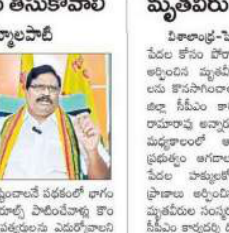
విశాలంధ్ర - నంద్యాల: సజ్జల వ్యాఖ్యలపై ఈసీ చర్యలు తీసుకోవాలి.