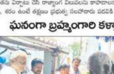
విశాలంధ్ర - పశ్చిమగోదావరి: ఘనంగా బ్రహ్మాండం కళ్యాణోత్సవం.

విశాలంధ్ర - పశ్చిమగోదావరి: ఘనంగా బ్రహ్మాండం కళ్యాణోత్సవం. ఘనంగా బ్రహ్మాండం కళ్యాణోత్సవం.