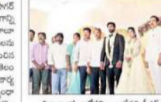
చిలుకోటి వారి వివాహ వేడుకల్లో జానపేష్.

చిలుకోటి వారి వివాహ వేడుకల్లో జానపేష్. చిలుకోటి వారి వివాహ వేడుకల్లో జానపేష్.