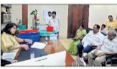
విశాలంధ్ర - గుంటూరు: అవసరమైన స్వేచ్ఛనలని లెక్కింపు కేంద్రానికి తరలింపాలి.

విశాలంధ్ర - గుంటూరు: అవసరమైన స్వేచ్ఛనలని లెక్కింపు కేంద్రానికి తరలింపాలి. నగర కమిషనర్ కిర్ర చేతుల.