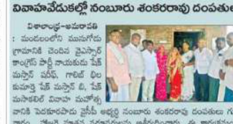
వివాహవేడుకల్లో గుంటూరు శరణారాధకు దంపతులు.

విశాలంధ్ర - ఆమోదించి: వివాహవేడుకల్లో గుంటూరు శరణారాధకు దంపతులు. వివాహవేడుకల్లో గుంటూరు శరణారాధకు దంపతులు.