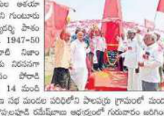
విశాలంధ్ర - పశ్చిమగోదావరి: మృతదేహాల ఆశయాలు కొనసాగించాలి.

విశాలంధ్ర - పశ్చిమగోదావరి: మృతదేహాల ఆశయాలు కొనసాగించాలి. మృతదేహాల ఆశయాలు కొనసాగించాలి.