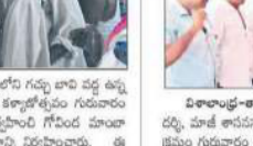
విశాలంధ్ర - పశ్చిమగోదావరి: మాజీ ఎమ్మెల్యే పుతులపాకకు ఘన నివాళి.

విశాలంధ్ర - పశ్చిమగోదావరి: మాజీ ఎమ్మెల్యే పుతులపాకకు ఘన నివాళి. మాజీ ఎమ్మెల్యే పుతులపాకకు ఘన నివాళి.