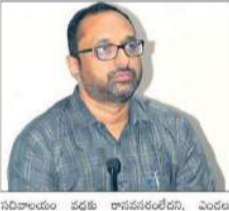
విశాలంధ్ర - నంద్యాల: పెన్షన్లకు రూ.83.79 కోట్లు విడుదల.

విశాలంధ్ర - నంద్యాల: పెన్షన్లకు రూ.83.79 కోట్లు విడుదల. అత్యధిక శ్రీశీల లక్ష. పెన్షన్లకు రూ.83.79 కోట్లు విడుదల.