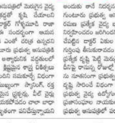
విశాలంధ్ర - గుంటూరు: ప్రభుత్వంపై సత్కారం మొదలుపెట్టిన వైద్యులను అందించాలి.

విశాలంధ్ర - గుంటూరు: ప్రభుత్వంపై సత్కారం మొదలుపెట్టిన వైద్యులను అందించాలి. ప్రభుత్వంపై సత్కారం మొదలుపెట్టిన వైద్యులను అందించాలి.