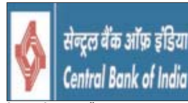
डिजाइन किया गया है।

पूरे भारत में अग्रणी उद्योग की कंपनियों के साथ गहरी विशेषज्ञता और रणनीतिक साझेदारी का लाभ उठाते हुए, एमओएस एक बहुमुखी समूह है जो डिजिटल बैंकिंग समाधान, यात्रा, उपयोगिताओं, बीमा और बहुत कुछ सहित सेवाओं की एक विस्तृत श्रृंखला की पेशकश करता है, जो व्यवसायों की बढ़ती जरूरतों को पूरा करने के लिए