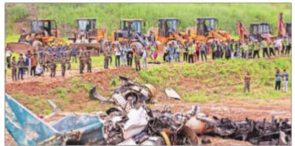
The small passenger plane belonged to Saurya Airlines

the officials said. 18 of those on board the CRJ-200 aircraft were Nepali citizens, with one engineer from Yemen, Saurya said. "Shortly after takeoff... the aircraft veered off to the right and crashed on the east side of the runway," the Civil Aviation Authority of Nepal said in a statement. —REUTERS