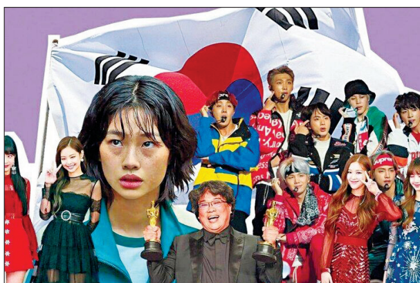
नफा नुकसान रिसर्च

बॉय बैंड बीटीएस ग्लोबल सुपरब्रांड बनकर जेनजी के दिल पर राज कर रहा है। कैपिटलिज्म के गढ़ कोरिया की के-वेव दुनिया को अपने साथ बहा ले जा रही है। के-वेव यानी कोरियन कल्चर की तरंग जिसे कोरियाई भाषा में हाल्यू भी कहते हैं। जैसे तो इसकी शुरुआत नब्बे के दशक में हुई थी लेकिन 2012 में आए साई के गाने गंगनम स्टाइल से यह दुनिया पर छा गई। जैसे तो कोरियाईयों की अंग्रेजी की झिझक और नॉन-फ्रेडली एटीट्यूड के लिए पहचान है लेकिन के-कल्चर भाषाओं की दीवार फांद चुकी है। शॉर्ट वीडियो स्ट्रीमिंग सर्विस टिकटॉक और कंतार की एक स्टडी रहती है कि के-कल्चर प्रॉडक्ट्स का मार्केट 2030 तक 143 बि. डॉलर का हो जाएगा। सोशल्ल प्लेटफॉर्म पर के-कॉन्टेंट का नशा सिर चढ़कर बोल रहा है। के-कल्चर में पॉप, ड्रामा, लाइफस्टाइल और विवजीन से लेकर कॉस्मेटिक्स तक सबकुछ शामिल है। टिकटॉक की शुरुआत अलग-अलग गानों पर तुमके लगाते शॉर्ट वीडियो प्लेटफॉर्म से हुई थी