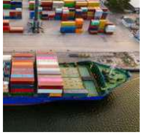
DE-DOLLARISATION? Exporters dealing in rupee can ship goods

The export of leather, leather products and footwear rose from $44.84 million in 2022-23 to $62.48 million in 2023-24. However, exports have declined to $14.21 million during April-