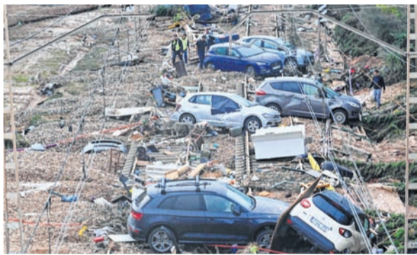
Cars swept away by floods in Valencia