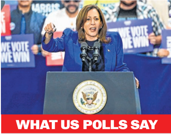
WHAT US POLLS SAY

Democratic presidential candidate Kamala Harris has voters that Republican Donald Trump and his allies would scale back healthcare programmes if he wins the White House and said his comments at a Wednesday rally were offensive to women.