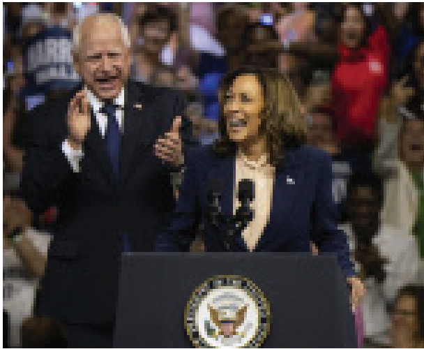
SPEAKING AT HER FIRST RALLY ALONGSIDE RUNNING MATE MINNESOTA GOVERNOR TIM WALZ IN PHILADELPHIA, HARRIS STATED, "THIS CAMPAIGN, OUR CAMPAIGN, IT'S NOT JUST A FIGHT AGAINST DONALD TRUMP. IT'S A FIGHT FOR THE FUTURE." WALZ, STANDING FIRMLY BY HER SIDE, ECHOED HER SENTIMENTS AND BOLSTERED HER MESSAGE.