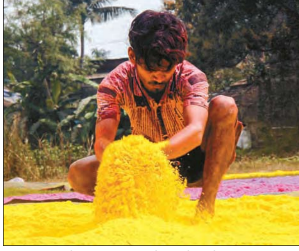
তৈরি হচ্ছে ভেজাব আবিব। বা রাসায়নিকমুক্ত এবং পরিবেশবান্ধব বসন্ত উৎসব পালনে ভেজাব আবিবই একমাত্র ভরসার। একদিনের এই আনন্দের রং খেলার জন্য চুল, চোখ