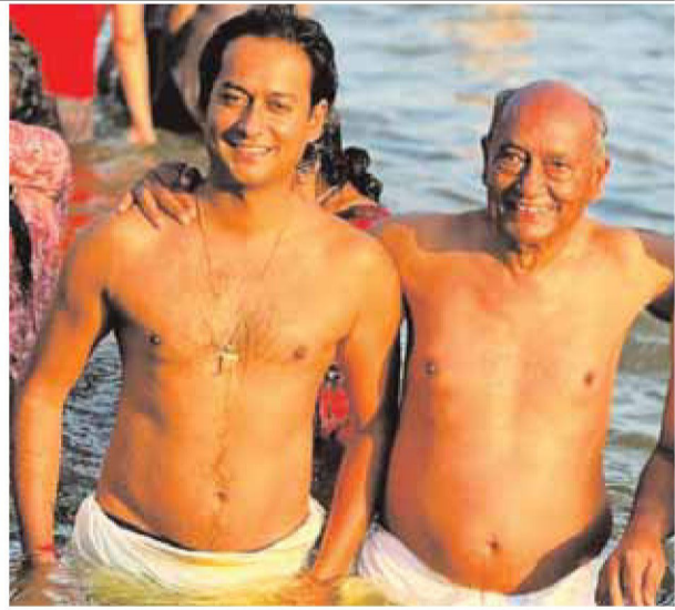
Senior Congress leader and Rajya Sabha MP Digvijaya Singh with his son Congress MLA Jaivardhan Singh take a holy dip at Triveni Sangam on Magh Purnima during Mahakumbh at Prayagraj, Uttar Pradesh on Wednesday.