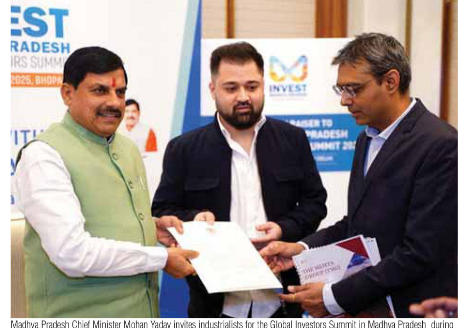
Madhya Pradesh Chief Minister Mohan Yadav invites industrialists for the Global Investors Summit in Madhya Pradesh during a curtain raiser programme in New Delhi on Wednesday.