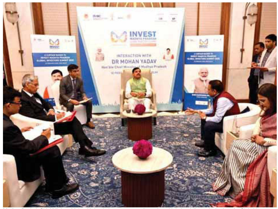
Madhya Pradesh Chief Minister Mohan Yadav during one-to-one discussion with industrialists to invite them for Global Investors Summit in Madhya Pradesh during a curtain raiser programme in New Delhi on Wednesday.

Global Investors Summit 2025 A Global Investors Summit will be held in Bhopal on February 24-25, 2025, to showcase Madhya Pradesh's efforts on the global stage. < The summit will be inaugurated by Prime Minister Narendra Modi, with leading industrialists, investors, and policymakers from both domestic and international markets expected to participate in this grand event. It will highlight the vast trade and investment opportunities available in Madhya Pradesh, helping propel the state's economic progress to new heights. Under the visionary leadership and positive policies of Chief Minister Mohan Yadav, Madhya Pradesh is not only strengthening its own economy but also playing a vital role in achieving Prime Minister Shri Modi's vision of a Vikas Bharat by 2047.