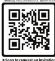
Scan to request an invitation

will provide valuable insights into their entrepreneurial journeys. Adding a dimension of innovation