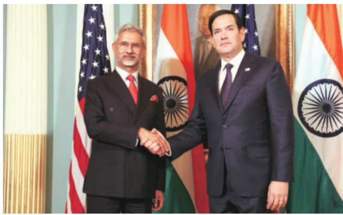
External Affairs Minister S Jaishankar (left) with US Secretary of State Marco Rubio, during a meeting in Washington DC, USA

"Reviewed our extensive bilateral partnership, of which @secrubio has been a strong advocate. Also exchanged views on a wide range of