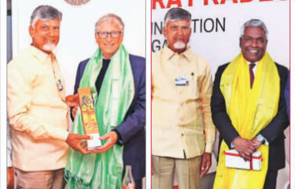
(Left) Andhra Pradesh chief minister N Chandrababu Naidu and Microsoft co-founder Bill Gates discussed setting up of an AI University in the state, among other topics; (right) Naidu also urged Google Cloud CEO Thomas Kurian to explore the possibility of setting up a design centre in Visakhapatnam