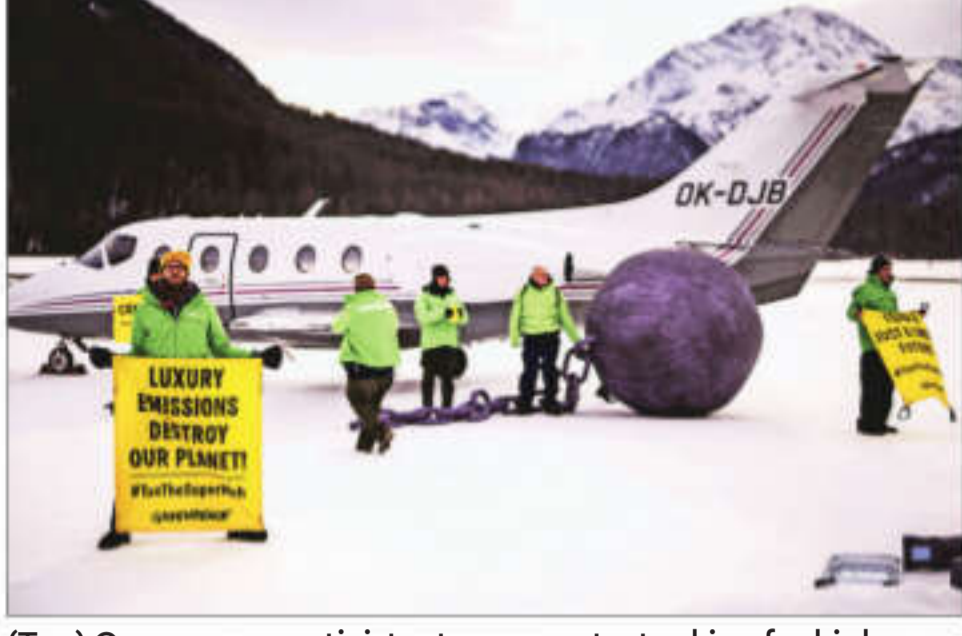
(Top) Greenpeace activists stage a protest asking for higher taxes for the super-rich people, in Samedan, Switzerland, on Wednesday; climate activist Luisa Neubauer takes part in a protest in Davos on Wednesday