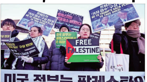
People gather to protest against US President Donald Trump's proposal for the Gaza Strip, near the US embassy, in Seoul on Wednesday

transfer of Palestinians and Turkey called the proposal "unacceptable". "China has always believed that Palestinians governing Palestine is the basic principle of post-conflict governance," China's foreign ministry