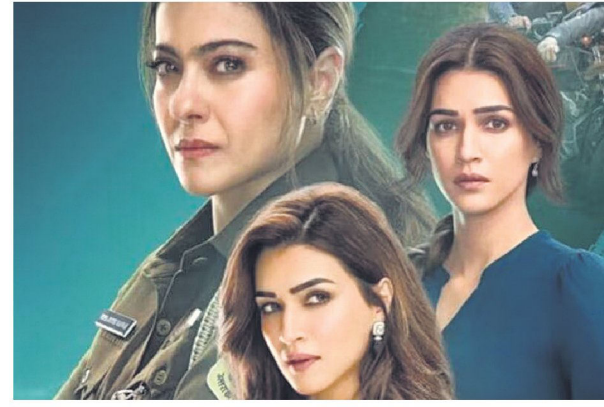
An Ormax report says that Do Patti, the top Hindi OTT movie, got 15.1 million views, or half of Mirzapur's viewership, in 2024.

"OTT original films have seen viewership challenges, and it is not surprising. Series format inherently have higher repeat engagement, social buzz and a longer shelf life, as