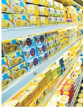
The sector could raise spends by at least 7-8% next fiscal

Suneera Tandon suneera@htlvtive.com NEW DELHI