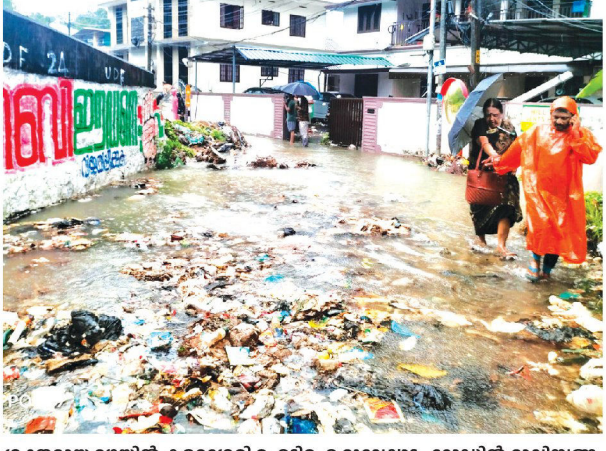
ശക്തമായ മഴയിൽ കളമശേരി ഐടിഐ മൂലേഷാടം റോഡിൽ മാലിന്യങ്ങ ൾ ഒഴുകുന്നു.

മഴക്കെടുതിയും അപകട സാധ്യതകളും വിളിച്ചറിയി ക്കുന്നതിനായി 24 മണിക്കൂറും പ്രവർത്തിക്കുന്ന കൺട്രോൾ റൂമുകൾ തുറന്നു. ജില്ലാ, താ ലൂക്ക് തലങ്ങളിലാണ് കൺ ട്രോൾ റാമാകൾ താറന്നിരിക്കാ ന്നത്. 1077, 1070 എന്നതാണ് ക ൺട്രോൾ റൂം നമ്പറുകൾ.