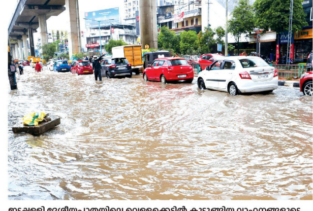
ഇടപ്പള്ളി ദേശീയപാതയിലെ വെള്ളക്കെട്ടിൽ കുടുത്ങിയ വാഹനങ്ങളുടെ