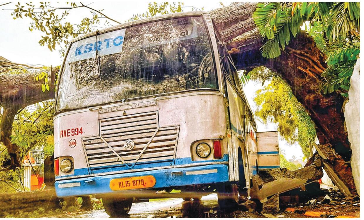
ശക്തമായ മഴയിൽ ഫോർട്ട്കൊച്ചിയിൽ കെഎസ്ആർടിസി ബസിനു മുകളിൽ മരം ഒടിഞ്ഞു വീണ നിലയിൽ

ക്കെട്ട് ഒഴിഞ്ഞിട്ടില്ല്. ഗാന്ധിനഗർ പിആൻഡി