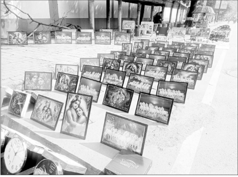
દોડતા ઘોડાની તસવીર ઘરમાં લગાવવી ઘણા લોકો શુક્રનિયાળ માને છે. ત્યારે વનિતા વિશ્વામના ફૂટપાથ પર દોડતા ઘોડાની કલાત્મક તસવીરો વેચાતી જોવા મળે છે.