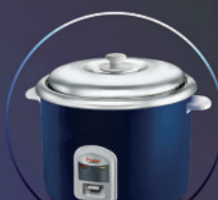
ELECTRIC RICE COOKER