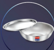
TRI-PLY SPLENDID COOKWARE