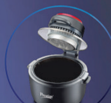
MULTI-CHEF ALL-IN-ONE AIRFRYER