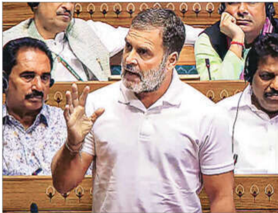
Leader of Opposition Rahul Gandhi, speaking during Question Hour on Monday, said there are "serious issues" in the examination system

Congress Lok Sabha MP Hibi Eden said data showed 70 instances of paper leaks in 15 states in the last seven years. Calling it the "biggest scam", he sought a high-level committee to probe the conduct of all competitive exams.