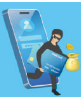
पोलिस अधिकाऱ्यांनी या गुंतवणूकदारांना याबाबतची तक्रार घेतली आहे. यात ३५ कोटींच्या मालमतीसह फसवणूक करायला लागले.