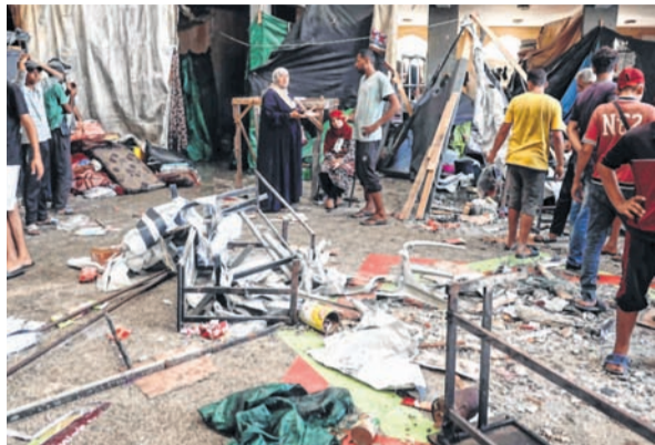
The damage caused at Rafida school following the air-strike

An Israeli airstrike on a school sheltering displaced Palestinians in central Gaza killed 28, including women and children, with a further 54 people injured according to The Guardian, which cited a Reuters news report.