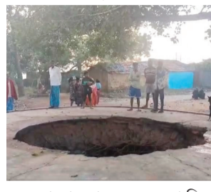
এবং ভালো সুস্বাদু জলের কুয়ো ছিল বলে জানান তাঁরা। দীর্ঘ সাতভাষ বছর ধরে এই কোটি এই স্থানে রয়েছে বলে স্থানীয় বাসিন্দারা জানান।

নিজস্ব প্রতিবেদন, অণ্ডাল: ধসপ্রবণ এলাকা খনি অঞ্চল অন্ডাল ও পাণ্ডুরামপুর লাইট দোহার বেশ কিছু জায়গায় বর্ষা হলেই ধসের লক্ষ্য করা যায়।