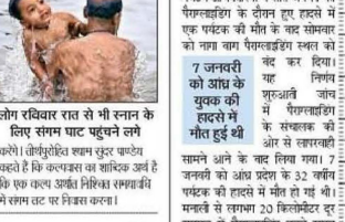
7 जनवरी को आठ पर्यटकों की मौत हुई थी। 7 जनवरी को आठ पर्यटकों की मौत हुई थी।

■ NBT रिपोर्ट, देहरादून: पर्यटक की मौत के बाद मनाली में पैराग्लाइडिंग बंद। पर्यटक की मौत के बाद मनाली में पैराग्लाइडिंग बंद।