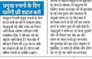
प्रमुख स्नानों के दिन चतुर्दशी पर शाल बसे। प्रमुख स्नानों के दिन चतुर्दशी पर शाल बसे।

■ NBT रिपोर्ट, प्रयागराज: महाकुंभ का पहला अमृत स्नान आज तुलसी, केला, जौ रोपकर शुरू किया कल्याण। महाकुंभ का पहला अमृत स्नान आज तुलसी, केला, जौ रोपकर शुरू किया कल्याण।