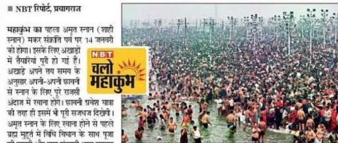
महाकुंभ के पहले दिन सेमवार को 1.65 करोड़ लोगों ने लखई स्नान में डुबकी खानी। इसमें कांठ खलाना भी किया जा रहा है।

■ NBT रिपोर्ट, प्रयागराज: महाकुंभ का पहला अमृत स्नान आज तुलसी, केला, जौ रोपकर शुरू किया कल्याण। महाकुंभ का पहला अमृत स्नान आज तुलसी, केला, जौ रोपकर शुरू किया कल्याण।