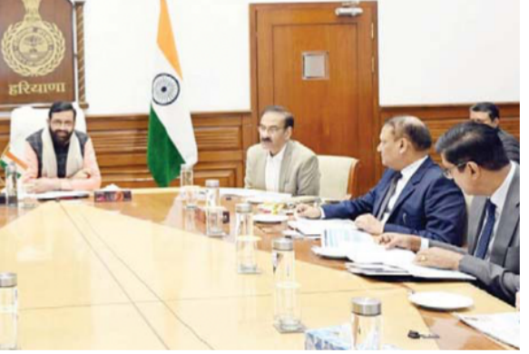
चंडीगढ़ में हाउसिंग बोर्ड की बैठक लेते हुए मुख्यमंत्री नायब सिंह सैनी।

मुख्यमंत्री की अध्यक्षता में आज चंडीगढ में आयोजित की गई हाउसिंग फॉर आल विभाग की समीक्षा बैठक ਸੇਂ यह जानकारी प्रदान की गई। योजना के तहत 100-100 वर्ग गज के प्लॉट शहरों की तर्ज पर सभी बुनियादी सुविधाओं से सुसज्जित विकसित कॉलोनियों में दिए जाएंगे। इसके लिए मुख्यमंत्री द्वारा 100 करो ? रूपए की राशि की स्वीकृति पहले ही प्रदान की जा चुकी है।