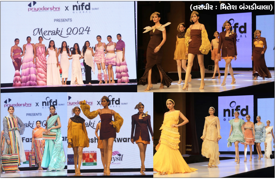
એનઆઈએફડી ગ્લોબલની ૨૫મી વર્ષગાંઠ પર વાર્ષિક ફેશન એવોર્ડ શો યોજાયો હતો.