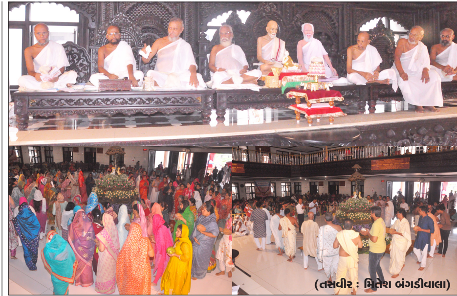
વેસુના ૪ સહિત સુરતના ૮-૮ સંઘોમાં સૌ પ્રથમ વાર એક સાથે એક તપનું આયોજન કરાવ્યું છે.