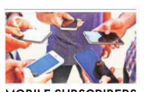
MOBILE SUBSCRIBERS NET ADDITIONS (in mn)