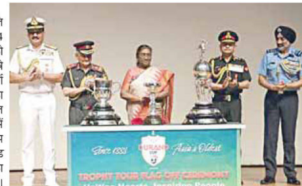
ड्रंड कप की ट्रॉफियों का अनावरण करतीं राष्ट्रपति द्रौपदी मुर्मु।

नयी दिल्ली, 10 जुलाई। राष्ट्रपति द्रौपदी मुर्मु ने ड्रांड कप ट्रनीमेंट 2024 में भाग लेने वाले सभी खिलाड़ियो को शुभकामनाएं देते हुये कहा है कि चाहे वे हारें या जीतें, खेल में स्वस्थ प्रतिस्पर्धा होनी चाहिए और उन्हें दूसरी टीमों का सम्मान करना चाहिए। राष्ट्रपति ने आज राष्ट्रपति भवन के सांस्कृतिक केंद्र में आयोजित एक समारोह में ड्रांड कप र्ट्नामेंट 2024 की तीन ट्रॉफियों, ड्रंड कप, प्रेसिडेंट कप और शिमला ट्राफी का अनावरण करते हुये उक्त बातें कहीं। राष्ट्रपति ने कहा कि फुटबॉल दुनिया के सर्वाधिक लोकप्रिय खेलों में से एक है।