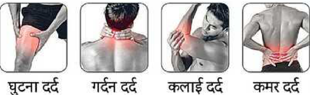
घुटना दर्द गर्दन दर्द कलाई दर्द कमर दर्द

24x7 Helpline : 7876977777 • www.drorthooil.com