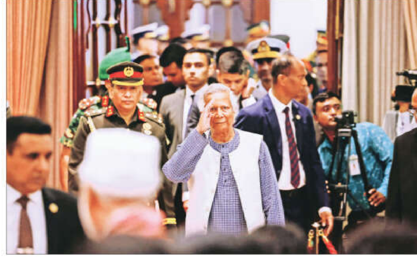
Our task is to carry out vital reforms in electoral system: Chief adviser Yunus

Noting that the current interim government led by him