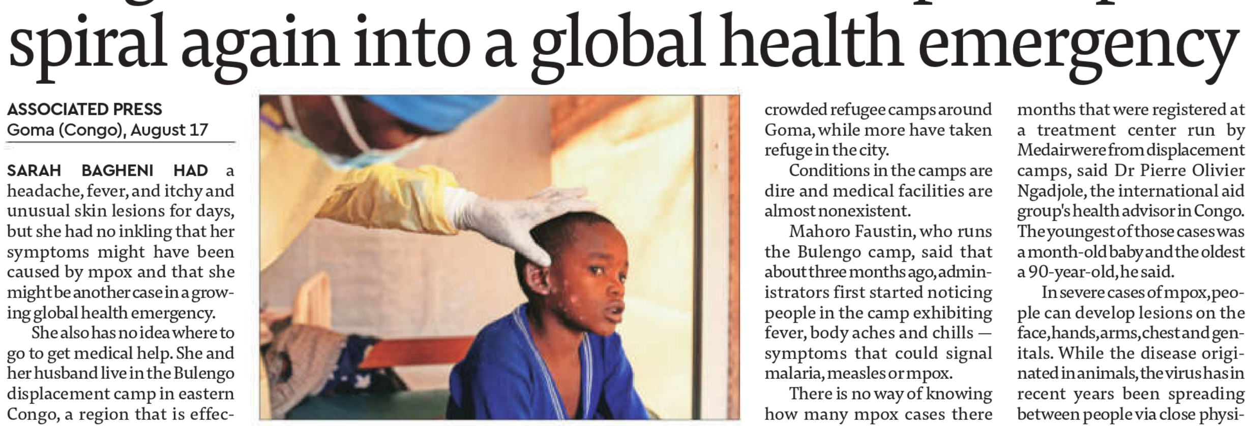
Mpox declared a global health emergency

This year's alarming rise in cases, including a new form of the virus identified by scientists in eastern Congo, led the World Health Organization to declare it a global health emergency on Wednesday. It said the new variant could spread beyond the five African countries where it had already been detected - a timely warning that came a day before Sweden reported its first case of the new strain.