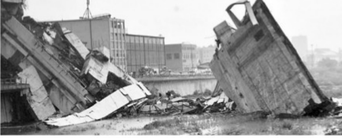
అపవేదిక చేసిన వారే 10 మంది అయ్యారు. ప్రధానంగా అపవేదిక చేసిన వారే 10 మంది అయ్యారు.

10 మంది మృతి రోమ్: ఇటలీలోని పోర్టోఫోర్నో అసోసియేషన్ 10 మంది కుటుంబాలను కలిగి ఉన్నది. ఈ కుటుంబాలలో 10 మంది అత్యధికంగా మృతి చెందారు. మరణాలకు కారణం గానవచ్చినట్లు, క్రమక్రమంగా అందరినీ ఒక్కొక్కరిగా అపవేదిక చేశారు. ప్రధానంగా అపవేదిక చేసిన వారే 10 మంది అయ్యారు. ప్రధానంగా అపవేదిక చేసిన వారే 10 మంది అయ్యారు. ప్రధానంగా అపవేదిక చేసిన వారే 10 మంది అయ్యారు.