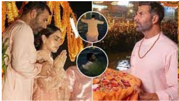
In one of her pictures, Manushi is seen praying, folding her hands, with her eyes closed. Before jumping into the

Mumbai, May 31 (IANS) As his film 'Samrat Prithviraj' is all set to release on the big screen, Bollywood's 'Khiladi' Akshay Kumar and his co-star Manushi Chhillar performed a puja on the banks of river Ganga in Varanasi. He was then seen taking a dip in the Ganga. Akshay took to Instagram, where he posted a video of himself wearing a pink kurta and holding a prayer plate in his hands with diyas and flowers in it. Manushi is seen standing next to him dressed in a pink salwar-kurta.