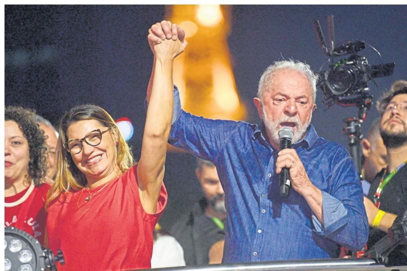
Brazilian president-elect Luiz Inacio Lula da Silva with his wife, Rosangela "Janja" da Silva, after winning the run-off election, in Sao Paulo, Brazil.

US President Joe Biden quickly congratulated Lula, saying the elections were "free, fair, and credible." China, Brazil's largest trading partner, also complimented the president-elect in a Twitter post by its local embassy.