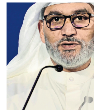
Opec Secretary-General Haitham Al Ghais

Russia's invasion of Ukraine in February, and the ensuing disruption of natural gas flows, has posed a further complication to 29%. The organization's outlook for oil isn't the only point of difference with western governments right now. Saudi Arabia irked the US last month with a decision to slash oil production by 2 million barrels a day. US officials complained that the move lends support to the Kremlin in its war on Ukraine, though Riyadh has said it was necessary to stabilize crude markets.