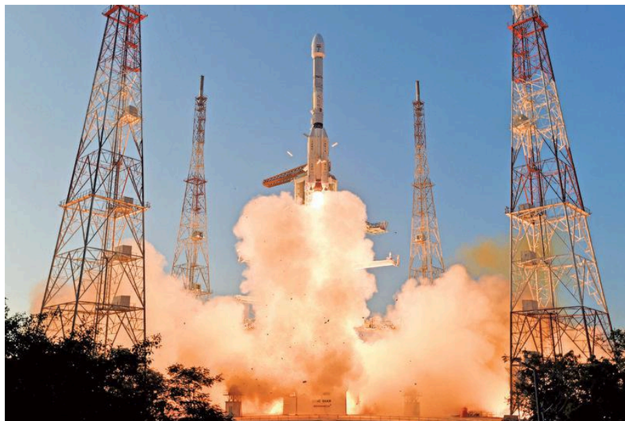
ROARING TO GO. ISRO's upcoming plans include sending Indians to space via Gaganyaan, exploring Venus with Sukrayaan, and missions to asteroids. Longer-term goals involve lunar missions and building Bharat Antariksh Station, an Indian space station

When the NDA government took over in 2014, the Indian space sector was thus fortified by the two successes and was licking its paws for further kills.