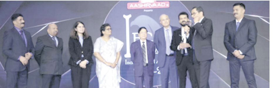
അമ്പൽമുട്ടിയിൽ ഉദ്യോഗസ്ഥരുടെ സാന്നിധ്യത്തിൽ കല്യാൺ ജൂവലേഴ്സ് കോർപ്പറേഷൻ നിലവിലുള്ള കോളങ്ങളുടെ ഉദ്ഘാടനം നടത്തിയ കല്യാൺ ജൂവലേഴ്സ് കോർപ്പറേഷൻ സീനിയർ മാനേജർമാർ.

കോച്ചി: ഇന്ത്യയിലെ യൂജിനിയയിലേയും വിശ്വാസ്യതയേറിയതും മനോഹരമായതുമായ കല്യാൺ ജൂവലേഴ്സിന്റെ എല്ലാ കോളങ്ങളും പ്രവർത്തനമാരംഭിക്കും. അന്നേ ദിവസം ഉപയോക്താക്കളുടെ തിരക്ക് കൈകാര്യം ചെയ്യുന്നതിനായി അക്ഷയ തൃതീയ സ്പെഷ്യൽ കൗൺസിലർമാർക്കും എക്സ്പെർട്ട് നൗഷെർമാർക്കും കോഴ്സിംഗും നൽകുന്നതിനും പാതയിലൂടെ സൗജന്യമായ ഓഫറുകളും നൽകുന്നതിനും തയ്യാറാകുന്നു. കല്യാൺ ജൂവലേഴ്സിന് വിറ്റഴിക്കുന്ന ആഭരണങ്ങൾ വിവിധ രാജ്യങ്ങളിലും പരിശോധനകൾക്ക് വിധേയമാക്കുന്നതിനും തയ്യാറാകുന്നു.