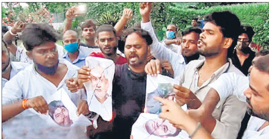
पटना में मंगलवार को लोजपा कार्यालय के बाहर चिराग पासवान को पार्टी प्रमुख से टटाने के खिलाफ प्रदर्शन करते समर्थक।

लोजपा संसदीय दल के नेता के रूप में लोकसभा अध्यक्ष द्वारा सोमवार को मंजूरी दिए जाने के बाद से ही पशुपति कुमार पारस ने पार्टी पर पकड़ मजबूत करने की कवायद शुरू कर दी।