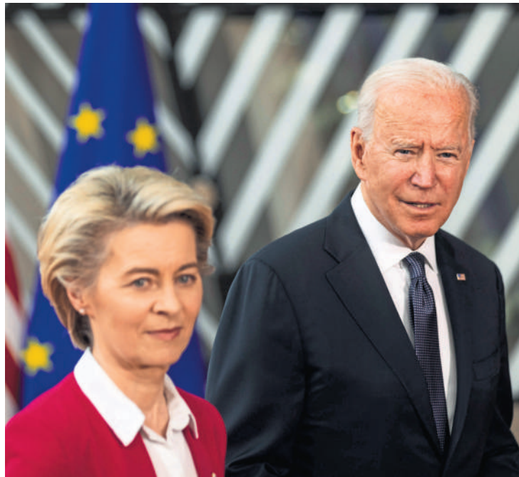
European Commission President Ursula von der Leyen met President Joe Biden, who is in Brussels to consult with allies. A resolution of the 17-year trade fight would reduce trade tensions between the two giant economies.

A resolution of the 17-year trade fight—the longest and most costly in the history of the World Trade Organization—would significantly reduce trade tensions between the two giant and deeply interlinked economies.