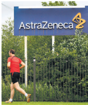
The Astra medicine attracted interest even before it could prove its efficacy.

AstraZeneca Plc's antibody cocktail was only 33% effective at preventing covid-19 symptoms in people who had been exposed to the virus, failing a study that was key to the drugmaker's pandemic push.