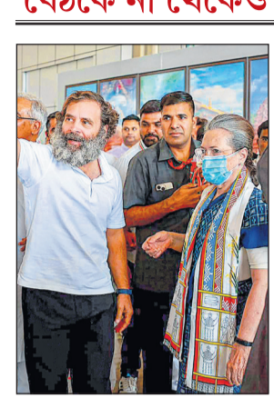
প্লেনারিতে যোগ দিতে রায়পুরে রাহুল ও সোনিয়া গান্ধী

সওয়াল হয়। দু’পক্ষের বাদানুবাদে সরগরম হয় স্টিয়ারিং কমিটির বৈঠক। সূত্রের খবর, বিয়টি সভাপতির উপর ছেড়ে দেওয়ার প্রস্তাব দেন মধ্যপন্থা