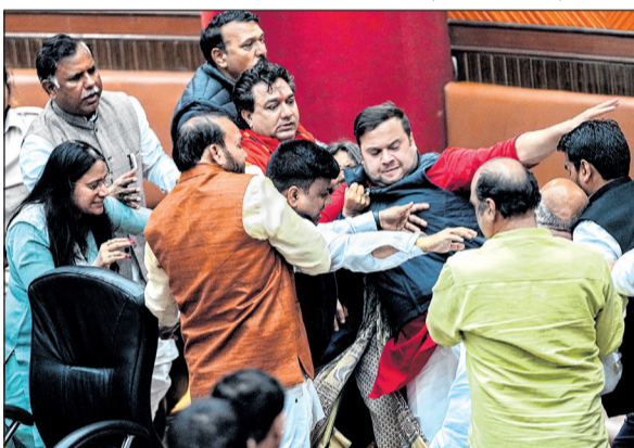
প্রাইমারি ক্লাসরুম নয়, এই হাতাহাতি দিল্লি পুরসভার অদরের। আপ এবং বিজেপি কাউন্সিলররা সভার মধ্যেই বেনজির বুদ্ধমার লড়াইয়ে নেমে পড়েন।