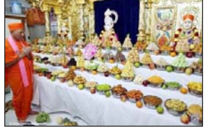
પરંતુ જેટલું ભગવાનનું ભજન, સ્મરણ કર્યું હશે તે જ સાથે આવવાનું છે. મંદિરે રોજ ભગવાનનાં દર્શન કરવા માટે હાકલ કરી હતી. કોઈ મુમુક્ષુ જાણે કે અજાણે આ મંદિરનાં પગથિયાં ચઢશે તથા ભગવાનનાં દર્શન કરશે તેની માટે અક્ષરધામના દ્વાર ખુલ્લા થશે એટલે કે એ જીવનું આત્યંતિક કલ્યાણ થશે.