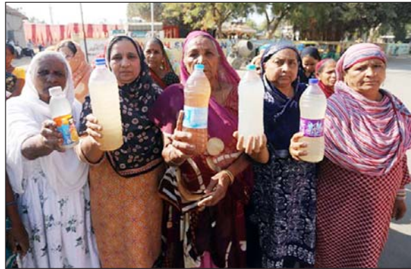
શહેરના મકરબા ગામમાં ગંદા પીવાના પાણીની સમસ્યાના લીધે રહીશોએ સરખેજ કોર્પો.ની ઓફિસ ખાતે જઈને ગંદા પાણીની બોટલો સાથે વિરોધ પ્રદર્શન કર્યું હતું.