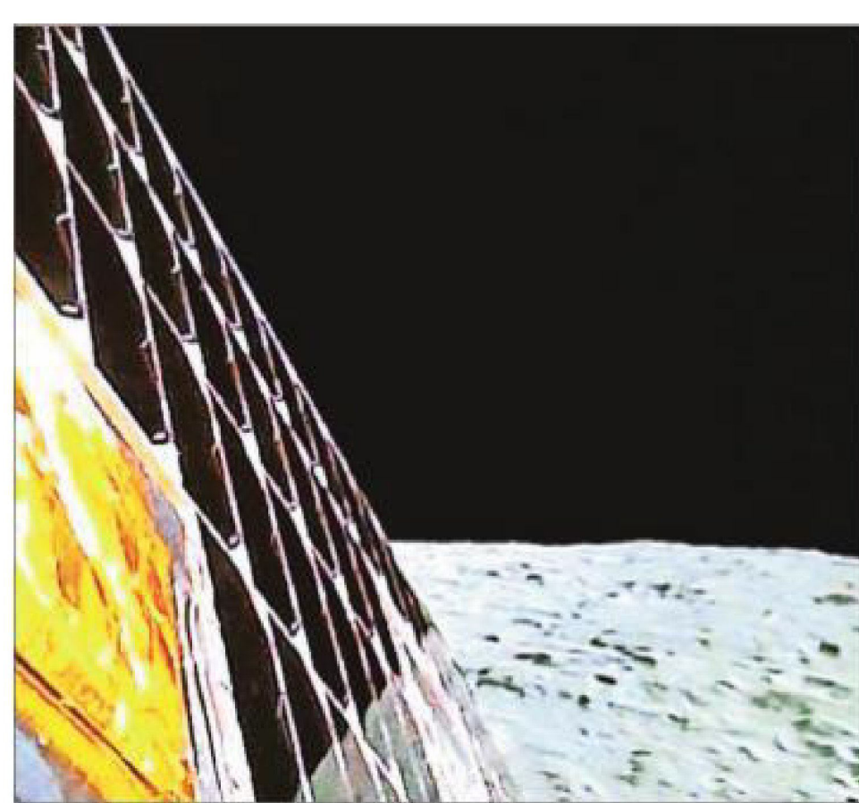
An image of the Moon, captured by the Lander Imager Camera 4 on board Chandrayaan-3, released on Tuesday

A WAVE OF anticipation swept the country as the Lander Module of Chandrayaan-3 prepared to make a "safe and soft landing" on the surface of the Moon on Wednesday evening and, in the process, become the first country to land a spacecraft on the lunar south pole.