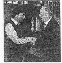
नई दिल्ली में गुरुवार को पहुंचे पुर्तगाल के राष्ट्रपति मार्सेलो रेबेलो।

सूत्रों के मुताबिक, यात्रा के दौरान राष्ट्रपति मार्सेलो रेबेलो डी सूसा का राष्ट्रपति भवन में औपचारिक स्वागत किया जाएगा, उसके बाद राजघाट का दौरा किया जाएगा। उपराष्ट्रपति एम वेकैया नायडू आने वाले गणमान्य लोगों