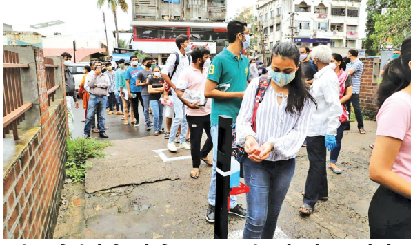
સહીતના ડિગ્રી કોર્સમાં એડમિશન મેળવવા માટે લેવામાં આવતી ગુજકેટની પરીક્ષા આજે શહેરના કુલ ૩૮ કેન્દ્રો પર યોજાવામાં આવી હતી. જેમાં શહેરમાંથી ૭૬૦૦ વિદ્યાર્થીઓ નોંધાયા હતા. આજની

વડોદરા, તા. ૨૪ કોવિડ-૧૯ની ગાઈડલાઈનના યુક્ત અમલ વચ્ચે આજે શહેરના કુલ ૩૮ કેન્દ્રો ખાતે ૭૬૦૦ વિદ્યાર્થીઓ માટે ગુજકેટની પરીક્ષાઓ યોજાઈ હતી. આ પરીક્ષામાં એક કોરોના સંક્રમિત વિદ્યાર્થી અને એક કેન્સર પીડિત વિદ્યાર્થીનીની પરીક્ષા આપવાની હોવાથી આ ૨ વિદ્યાર્થીઓ માટે વડોદરા જિલ્લા શિક્ષણાધિકારી કચેરી દ્વારા શહેરની ૨ સ્કૂલમાં અલગ રૂમની વ્યવસ્થા કરવામાં આવી હતી. કોરોના મહામારી બાદ આજે સૌપ્રથમ વખત વિદ્યાર્થીઓની વર્ગખંડમાં પરીક્ષા લેવાઈ હતી. ધોરણ ૧૨ વિજ્ઞાન પ્રવાહની પરીક્ષા આપ્યા બાદ એન્જનીયરીંગ