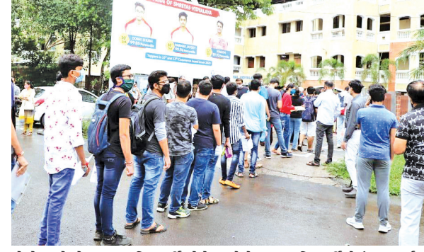
કોરોનાનો ચેપ અન્ય વિદ્યાર્થીઓને ન લાગે તે માટે સ્કૂલમાં કોરોનાગ્રસ્ત વિદ્યાર્થી માટે અલગ જ એક રૂમ ફાળવવામાં આવ્યો હતો અને પરીક્ષા પૂર્ણ થયા બાદ રૂમને સેનેટાઈઝ કરવામાં આવ્યો હતો અને સ્કૂલ દ્વારા

હતો. જેમાં વોકેટરે જણાવ્યું હતું કે, કેન્સર પીડિત વિદ્યાર્થીનીની બધાની વચ્ચે રાખવી જોખમકારક હોવાથી અલગ રૂમની વ્યવસ્થા કરવી. જેથી તેના માટે સમા વિસ્તારની નવરચના વિદ્યાલયમાં અલગ રૂમની વ્યવસ્થા કરવામાં આવી હતી. કોવિડ-૧૯ની ગાઈડલાઈન પ્રમાણે થર્મલ ગનમાં જે વિદ્યાર્થીઓનું ટેમ્પરેચર વધારે આવે, અથવા તો કોવિડના શંકાસ્પદ લક્ષણો જણાવે તેવા તમામ વિદ્યાર્થીઓ માટે અલગ રૂમની વ્યવસ્થા કરવામાં આવ્યો જન હતું. જોકે, સદ્ગતિથી શહેરમાંથી આ બે વિદ્યાર્થીઓ સિવાય અન્ય કોઈ વિદ્યાર્થી માટે અલગ રૂમની વ્યવસ્થા કરવાની જરૂર પડી ન હતી.