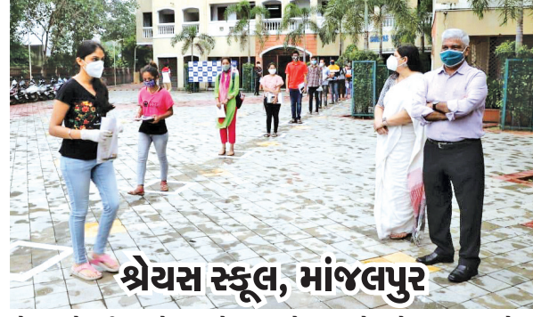
શ્રેયસ સ્કૂલ, માંજલપુર હોમ ક્વોરન્ટીન થયેલા શહેરના એક વિદ્યાર્થીએ રવિવારે બપોરે ગુજરાત માધ્યમિક શિક્ષણ બોર્ડમાં ફોન કરીને પરીક્ષા આપવા માટે માંગણી કરી હતી. વિદ્યાર્થીના ફોન બાદ બોર્ડમાંથી ડી.ઈ.ઓ કચેરીને