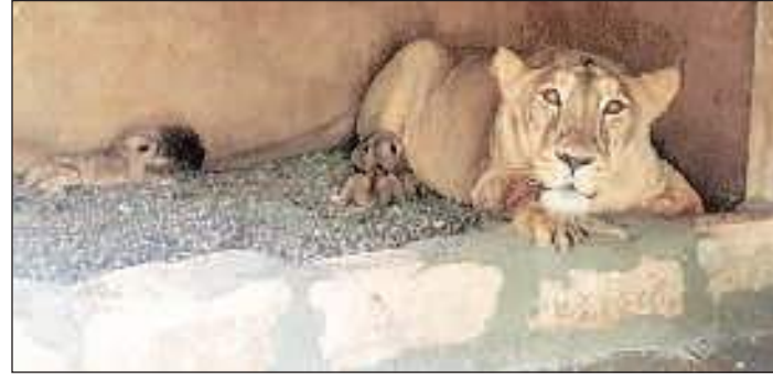
Preparations for the 15th lion population estimation exercise were on in full swing when the nationwide lockdown was enforced in March.

With the southwest monsoon approaching Gujarat and parts of the state already witnessing rain under the influence of cyclone Nisarg, the Forest Minister remained non-committal when asked about when the 15th lion census would be conducted.