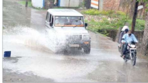
जागरण, रीवा। जिले में आते ही मानसूनी हवाएं सीमाई क्षेत्रों में मेहतरबान लगीं। विद्यालयों में प्रवेश का शुभ दिन है।

मऊजों में 54 मि.मी. वर्षा दर्ज, हनुमान, त्योंर, नईगढ़ी में भी गिरा पानी