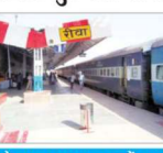
जागरण, रीवा। रेल यात्रा के दौरान लापरवाही करने पर यात्रियों को नुकसान लाने की चेतावनी जारी है।

कोरोना बचाव की गाइडलाइन का उल्लंघन करने वाली पर खतरा