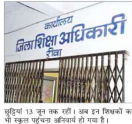
स्कूलों में चहल पहल दिखने के दिनों

सरकारी विद्यालयों में आज का दिन का विशेष अर्थ है। विद्यालय प्रशासकों को उम्मीद है कि आज के दिन विद्यालयों में प्रवेश का शुभ दिन होगा। कक्षा 1 में प्रवेश के लिए विद्यालयों में प्रवेश का शुभ दिन होगा। कक्षा 1 में प्रवेश के लिए विद्यालयों में प्रवेश का शुभ दिन होगा। कक्षा 1 में प्रवेश के लिए विद्यालयों में प्रवेश का शुभ दिन होगा।