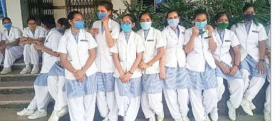
जागरण, रीवा। शासकीय स्टापेंड नर्सिंग छात्राओं को कलेक्टर ने भुगतान नहीं किया।

2 साल से नहीं मिला नर्सिंग छात्राओं को स्टापेंड। शासकीय स्टापेंड नर्सिंग छात्राओं को कलेक्टर ने भुगतान नहीं किया।