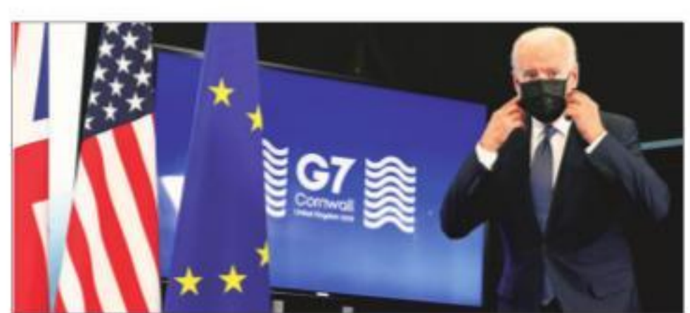
US President Joe Biden arrives for a news conference at the end of the G7 summit, at Cornwall Airport Newquay, in Britain, on Sunday