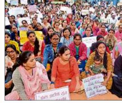
ಸ್ವಾತಂತ್ರ್ಯ ಉದ್ಘಾಟನೆಯಲ್ಲಿ ಭಾಗವಹಿಸಿದವರು.

ಬೆಂಗಳೂರು: ಸ್ವಾತಂತ್ರ್ಯ ಉದ್ಘಾಟನೆಯಲ್ಲಿ ಭಾಗವಹಿಸಿದರು. ಸ್ವಾತಂತ್ರ್ಯ ಉದ್ಘಾಟನೆಯಲ್ಲಿ ಭಾಗವಹಿಸಿದರು. ಸ್ವಾತಂತ್ರ್ಯ ಉದ್ಘಾಟನೆಯಲ್ಲಿ ಭಾಗವಹಿಸಿದರು.