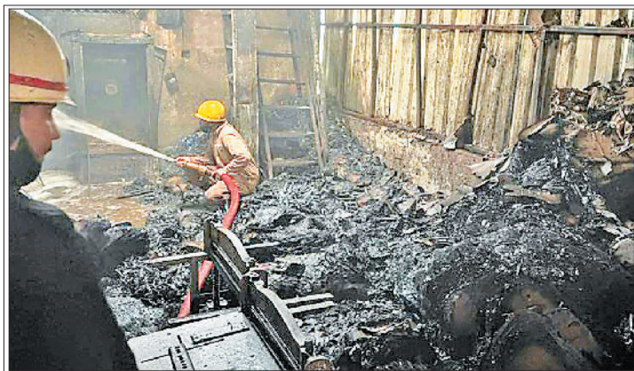
संकरि गलिया होने के कारण दमकल विभाग की गाड़ियों को फैक्ट्री तक पहुंचने हुई परेशानी

ताहिरपुर स्थित फ्रेंड्स कॉलोनी औद्योगिक क्षेत्र में शनिवार सुबह एक प्लास्टिक सीट व गत्ते की फैक्ट्री में भीषण आग लग गई। सूचना मिलते ही दमकल विभाग की एक दर्जन से अधिक गाड़ियां मौके पर पहुंच गईं। दमकल विभाग ने कड़ी मशक्कत के बाद आग पर काबू पाया। हादसे में किसी के हताहत नहीं हुई, लेकिन लाखों रुपये का माल जलकर खाक हो गया। हादसे के वक्त फैक्ट्री बंद थी। इससे आशंका व्यक्त की जा रही है कि आग शार्ट सर्किट के चलते लगी है। पुलिस मामले दर्ज कर जांच कर रही है। दमकल विभाग के डायरेक्टर अतुल गर्ग के अनुसार, दमकल