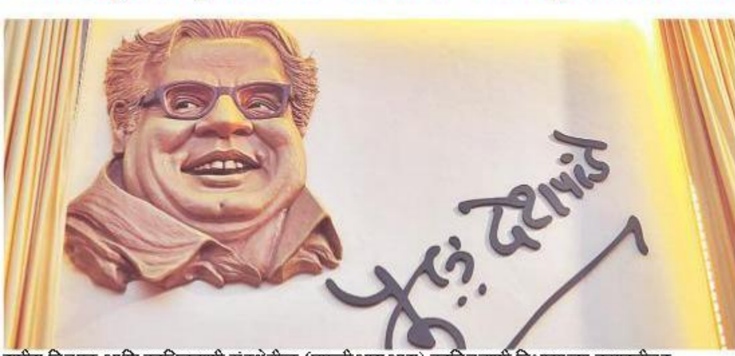
राष्ट्रीय चित्रपट आणि दूरचित्रवाणी संस्थेतील (एफटीआयआय) दूरचित्रवाणी विभागाच्या इमारतीवर साकारण्यात आलेल्या पु. ल. देशपांडे यांच्या भित्तिचित्राचे अनावरण लष्करप्रमुख मनोज नरवणे यांच्या हस्ते शुक्रवारी करण्यात आले.

लष्करप्रमुखांकडून चित्रपट माध्यमाचा गौरव; दूरचित्रवाणी विभागाच्या इमारतीला पु. ल. देशपांडे यांचे नाव