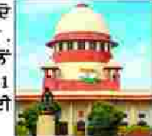
ਨਵੀਂ ਦਿੱਲੀ, 6 ਸਤੰਬਰ: ਸੁਪਰੀਮ ਕੋਰਟ ਨੇ ਸੁਭਾਅ ਨੂੰ ਐਡੀਟਰਜ਼ ਗਿਲਡ ਦੇ ਚਾਰ ਮੈਂਬਰਾਂ ਨੂੰ ਸਜ਼ਾਯੋਗ ਕਾਰਵਾਈ ਤੋਂ ਰਾਹਤ ਦੇਣ ਦੀ ਹਦਾਇਤ ਦਿੱਤੀ।

ਨਵੀਂ ਦਿੱਲੀ, 6 ਸਤੰਬਰ: ਸੁਪਰੀਮ ਕੋਰਟ ਨੇ ਸੁਭਾਅ ਨੂੰ ਐਡੀਟਰਜ਼ ਗਿਲਡ ਦੇ ਚਾਰ ਮੈਂਬਰਾਂ ਨੂੰ ਸਜ਼ਾਯੋਗ ਕਾਰਵਾਈ ਤੋਂ ਰਾਹਤ ਦੇਣ ਦੀ ਹਦਾਇਤ ਦਿੱਤੀ। ਜਿਸ ਤੋਂ ਪਹਿਲਾਂ ਕੋਰਟ ਨੇ ਸੁਭਾਅ ਨੂੰ ਐਡੀਟਰਜ਼ ਗਿਲਡ ਦੇ ਚਾਰ ਮੈਂਬਰਾਂ ਨੂੰ ਸਜ਼ਾਯੋਗ ਕਾਰਵਾਈ ਤੋਂ ਰਾਹਤ ਦੇਣ ਦੀ ਹਦਾਇਤ ਦਿੱਤੀ।