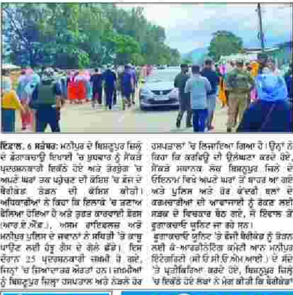
ਇਕਾਦਸ਼, 6 ਸਤੰਬਰ: ਮਨੀਪੁਰ ਦੇ ਸਿਮਤਪੁਰ ਜਿਲ੍ਹੇ ਦੇ ਫ਼ੌਜਵਾਨਾਂ ਦੀ ਵੱਡੀ ਗਿਣਤੀ 'ਚ ਸੁਭਾਅ ਨੂੰ ਸਮਝਾਉਣ ਦੀ ਕੋਸ਼ਿਸ਼ ਕੀਤੀ ਗਈ ਅਤੇ ਕੋਰਬੰਗ 'ਚ ਫ਼ੌਜ ਦੇ ਬੈਰੀਕੇਡ ਤੋੜਨ ਦੀ ਕੋਸ਼ਿਸ਼ ਕੀਤੀ।

ਤੋਰਬੁੰਗ 'ਚ ਅਪਣੇ ਘਰਾਂ ਤਕ ਪਹੁੰਚਣ ਦੀ ਕੋਸ਼ਿਸ਼ ਕਰ ਰਹੇ ਹਨ ਪ੍ਰਦਰਸ਼ਨਕਾਰੀ, ਸੈਂਕੜੇ ਲੋਕਾਂ ਨੂੰ ਕਰਫਿਊ ਦੀ ਉਲੰਘਣਾ ਕੀਤੀ, ਪੁਲਿਸ ਅਤੇ ਕੋਂਦਰੀ ਫ਼ੌਰਸਾਂ ਦਾ ਰਾਹ ਰੋਕਿਆ