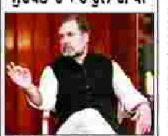
ਨਵੀਂ ਦਿੱਲੀ, 6 ਸਤੰਬਰ: ਕਾਂਗਰਸ ਦੇ ਸਾਬਕਾ ਪ੍ਰਧਾਨ ਰਾਹੁਲ ਗਾਂਧੀ ਨੇ ਸੁਭਾਅ ਨੂੰ ਸਮਝਾਉਣ ਦੀ ਕੋਸ਼ਿਸ਼ ਕੀਤੀ।

ਗੁਰਦ, ਇੰਡੀਆ ਸਾਂ ਗਿਦ੍ਰਿਸ਼ਤਾਨ, ਸੱਚ ਦਾ ਮਤਲਬ ਮੁਹੱਬਤ ਹੈ: ਰਾਹੁਲ ਗਾਂਧੀ