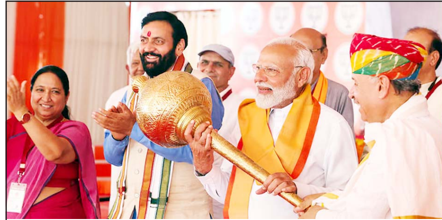
લોકસભાની ચોજાઈ રહેલી ચૂંટણીને લઈને હરિયાણામાં મહેન્દ્રગઢ ખાતે ગુરુવારે ચોજાયેલી ભાજપની ચૂંટણીરેલીને સંબોધવા આવી પહોંચેલા વડાપ્રધાન નરેન્દ્ર મોદીનું ગદા એનાયત કરી હરિયાણાના મુખ્યમંત્રી નાયબ સિંઘ સૈની અભિવાદન કરી રહ્યા છે.

મહેન્દ્રગઢ, તા. ૨૩ લોકસભા ચૂંટણીના છઠ્ઠા તબક્કાના પ્રચાર માટે હરિયાણાના મહેન્દ્રગઢ પહોંચેલા વડાપ્રધાન નરેન્દ્ર મોદીએ કોંગ્રેસ પર આકરા પ્રહારો કર્યા હતા. તેમણે કહ્યું કે કોંગ્રેસની સરકાર ૭ જન્મોમાં પણ બનવાની નથી. કોંગ્રેસને આપવામાં આવેલ દરેક વોટ નકામાં રહેશે. વિપક્ષી ગઠબંધન ઈન્ડિયા પર નિશાન સાધતા તેમણે કહ્યું કે ગાયે દૂધ હજી આપ્યું નથી કે ઘી ખાવા માટે ભારત ગઠબંધનના લોકો વચ્ચે લડાઈ શરૂ થઈ ગઈ છે. કલેવાય છે કે પાંચ વર્ષમાં પાંચ પીએમ થશે. પાંચ વર્ષમાં પાંચ પીએમ, હરિયાણાના લોકો ૫૦૦૦ જોડા બનાવશે. ઈન્ડિયા ગઠબંધનના લોકો અત્યંત સાંપ્રદાયિક, અત્યંત જાતિવાદી, અત્યંત કુટુંબ આધારિત છે. હરિયાણા સાથેના પોતાના લગાવ વિશે વાત કરતા પીએમ