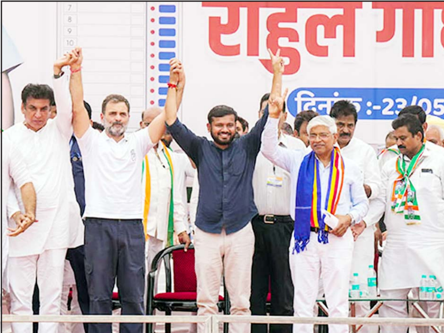
લોકસભાની ચોંટણી રહેલી ચૂંટણીમાં નોર્થ ઈસ્ટ દિલ્હી બેઠકના કોંગ્રેસના ઉમેદવાર કનૈયાલાલ શર્માની તેના વિસ્તારમાં ચોજાયેલી ચૂંટણી રેલીમાં કોંગ્રેસના નેતા અને રાયબરેલીના ઉમેદવાર રાહુલ ગાંધી કોંગ્રેસના નેતા સચિવ પાયલોટ, કેસી વેણુગોપાલ સ્ટેજ પર એક બીજાના પકડેલા હાથ ઉંચા કરી એકતા દર્શાવી રહ્યા છે.