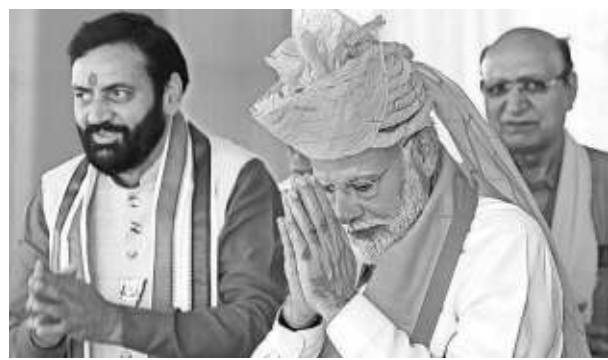
Prime Minister Narendra Modi with Haryana Chief Minister Nayab Singh Saini in Mahendragarh on Thursday

HOURS BEFORE campaigning for the sixth round of the Lok Sabha polls came to an end, Prime Minister Narendra Modi said "even a child knows whose government is going to be formed" and said every vote in favour of the Congress would "go in vain". "When we know their government is not going to be formed, will anybody vote for them? Will any farmer sow seeds on a barren land? I don't even need to tell this to Haryana. On May 25, you will not only choose the Prime Minister, but you will also choose the nation's future. On one side, is your tried and tested sevak Modi, but who is on the other side? Nobody even knows," said Modi. He said that the opposition