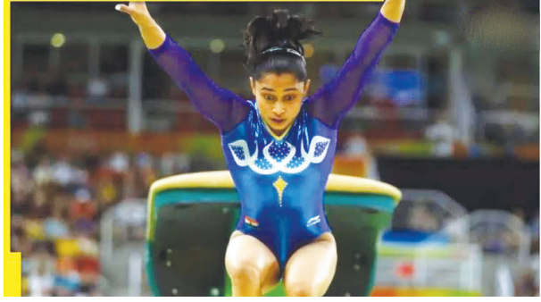
ನಿಷೇಧಿತ ಪದಾರ್ಥಗಳನ್ನು ಸೇವಿಸಿದ್ದಕ್ಕಾಗಿ ಜಿಮ್ಯಾಸ್ಕಿ ದೀಪಾ ಕರ್ಮಕರ್ ಅವರನ್ನು 21 ತಿಂಗಳ ಕಾಲ ನಿಷೇಧಿಸಲಾಗಿದೆ.

ನವದೆಹಲಿ, ಫೆ.4-ಜಿಮ್ಯಾಸ್ಕಿ ನಲ್ಲಿ ಪ್ರಥಮ ಬಾರಿಗೆ ಒಲಿಂಪಿಕ್‌ನಲ್ಲಿ ಭಾರತ ದೇಶವನ್ನು ಪ್ರತಿನಿಧಿಸಿದ್ದ ಜಿಮ್ಯಾಸ್ಕಿ ದೀಪಾ ಕರ್ಮಕರ್ ಅವರಿಗೆ ಅಂತಾರಾಷ್ಟ್ರೀಯ ಪರಿಷ್ಕಾ ಸಂಸ್ಥೆ ನಿಷೇಧ ವಿಧಿಸಿದೆ. ಕರ್ಮಕರ್ ಅವರನ್ನು ಆಟಗಳಿಂದ ನಿಷೇಧಿಸಲಾಗಿದೆ. ಡೋಪ್ ಪರೀಕ್ಷೆಯಲ್ಲಿ ಪಾಸಿಟಿವ್ ಬಂದ ಹಿನ್ನೆಲೆಯಲ್ಲಿ ದೀಪಾ ಕರ್ಮಕರ್ ಮೇಲೆ 21 ತಿಂಗಳ ನಿಷೇಧ ಹೇರಲಾಗಿದೆ. ದೀಪಾ