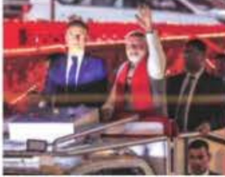
दोनों नेताओं ने सड़क के दोनों ओर खड़े जनसमूह का अभिवादन स्वीकार किया।

प्रधानमंत्री नरेंद्र मोदी और फ्रांस के राष्ट्रपति एमैनुएल मैक्रों ने गुरुवार को जयपुर के परकोटे में स्थित जंतर मंतर से हवा महल तक रोड शो किया। रोड शो के दौरान प्रधानमंत्री मोदी व राष्ट्रपति मैक्रों खुली छत वाले एक वाहन में सवार थे। दोनों नेताओं ने सड़क के दोनों ओर खड़े जनसमूह का अभिवादन स्वीकार किया। लोगों ने ‘मोदी-मोदी’ के नारे भी लगाए। उनपर अनेक स्थानीय पर फूलों की वर्षा की गई। बड़ी संख्या में लोगों ने हाथ में तिरंगे तथा फ्रांस के राष्ट्रध्वज ले रखे थे। कई लोगों ने हाथों में मोदी के पोस्टर धामे हुए थे। सड़क पर मोदी व मैक्रों के कटआउट भी लगाए गए थे।