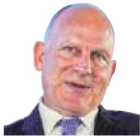
"Though we still have a long way to go to upgrade the legacy fleet, improve our consistency, close remaining gaps and strengthen fragile processes, the future is now more visible"

The airline started the commercial operations of its first A350 aircraft on January 22, with a flight from Mumbai to Chennai. Meanwhile, the Tata Group-owned airline will begin the process of upgrading 40 B787 and B777 aircraft in its fleet by July this year which would include completely replacing seats and entertainment systems on these planes. Similarly, it will commence the