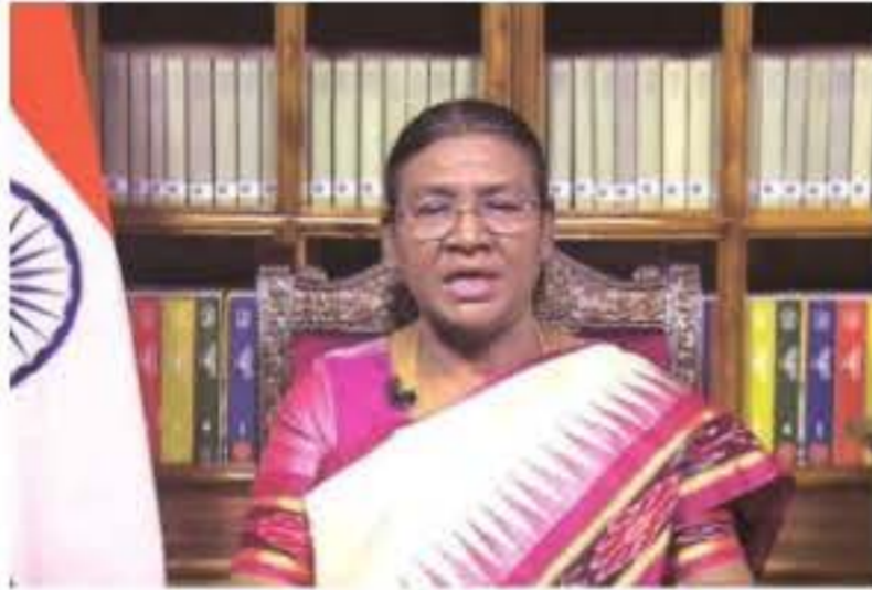
राष्ट्र को संबोधित करती राष्ट्रपति द्रौपदी मुर्मू

देशवासियों को गणतंत्र दिवस की शुभकामनाएं देते हुए उन्होंने कहा, ‘इस सप्ताह के आरंभ में हम सबसे आयोध्या में प्रभु श्रीराम के जन्मस्थान पर निर्मित भव्य मंदिर में स्थापित मूर्ति की प्राण प्रतिष्ठा का ऐतिहासिक समारोह देखा।’ उन्होंने कहा, ‘भविष्य में जब इस घटना को व्यापक परिप्रेक्ष्य में देखा जाएगा तब इतिहासकार, भारत द्वारा अपनी सभ्यतागत विरासत की निरंतर खोज में युगांतरकारी आविष्कार के रूप में इसका विवेचन करेंगे।’