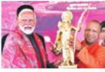
प्रधानमंत्री को प्रतीक विष्टन प्रदान करते योगी