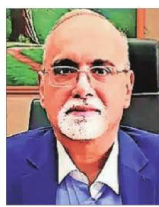
Reserve Bank of India deputy governor Rajeshwar Rao asked NBFCs to be mindful of their underwriting practices

RESERVE BANK OF India (RBI) deputy governor Rajeshwar Rao on Friday said it is "uncharacteristic" of non-bank lenders (NBFCs) to seek bank licences, given the regulatory advantages they enjoy. Regulations for even top-tier NBFCs are not at par with universal banks, he said.